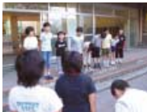
あいさつをする生徒たち (東小学校)

伊東市内のすべての小中学校において、あいさつ運動を進めています。学校の取り組みの一部を紹介します。