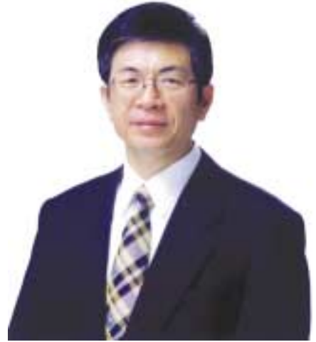
青年や高校生など、若い人々を中心として皆が温かく祝える式典を開催