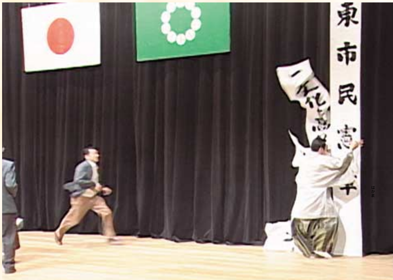
成人式で、伊東市の市民憲章が成人によって引きずり降ろされた瞬間。職員が制止しようと左から駆けつけている。写真には加工を施してあります。