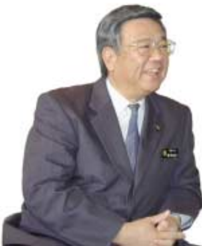
地域の独自性を生かし若者を地域と結びつける式典運営が定着