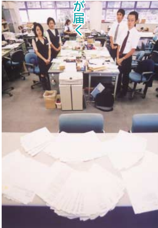
担当課である生涯学習課には、多数の意見が寄せられた （カウンターに並べられてあるのはEメールで送られた意見を印刷したもの）

1月28日、市は告訴状を伊東警察署に提出。4月19日付けで、成人6人が罰金刑（略式起訴）になり、3人が起訴猶予処分（不起訴）となった。